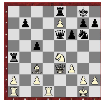
Stellung nach dem 25. Zug von Schwarz

26. ... Kf7; 27. Dxe6+ Kxe6; 28. Sxe8 (und Weiß gewinnt noch mehr Material)